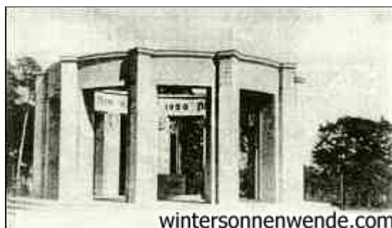
Das Abstimmungsdenkmal in Allenstein: "Wir bleiben deutsch!"