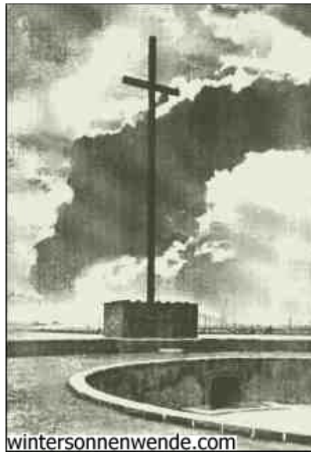
Das Denkmal für Albert Leo Schlageter in der Golzheimer Heide