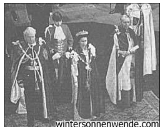
Sir Arthur Harris' Aufnahme in den Knights Grand Cross of the Order of the Bath in der Westminster Abbey im Oktober 1972. Zur linken der Königin ist der Dean of Westminster, der sehr wohl an Harris' Seite hätte stehen sein können vor einer viel ernsteren Zeremonie, wenn England den Krieg verloren hätte.

Indem sie nach dem Krieg über Harris schrieben, bemerkten die Historiker der britischen Geschichte des Zweiten Weltkrieges: "Sir Arthur Harris machte es sich zur