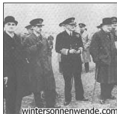
Die ursprünglichen Wegweiser, die Bomber Command zu der Flächenbombardierung von Deutschlands Stadtbevölkerung führten: F.A. Lindemann (links) und Winston Churchill (rechts). Zwischen ihnen stehen Air Chief Marshal Sir Charles Portal und Erster Seelord Sir Dudley Pound.

Es gab natürlich Diskussionen und Unstimmigkeiten betreffs der strategischen und taktischen Methoden der Bombardierung Deutschlands. Aber Lindemanns Bericht wird als grundlegender Text hinter der Bombardierung von zivilen Zielen im großen Maßstab angesehen. Vor der Absendung des Berichtes an Churchill, enthielt eine Anweisung des Luftministeriums an das Bomber