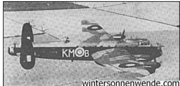
Der viermotorige Lancasterbomber war das Gegenstück der RAF zur amerikanischen B-17 und die Hauptstütze in der Luftoffensive des Bomber Command. In der Nacht vom 13. zum 14. Februar 1945 griffen Lancasterbomber Dresden mit Brandbomben und Sprengbomben an.

Auf der verkohlten Straße nach Dresden gab es viele Vorkommnisse, die dem ähnlich waren, was sich in Hamburg abspielte. Die Bomber Command Diaries für Darmstadt in der Nacht vom 11.-12. September 1944 berichten, daß 226 Lancasters und 14 Mosquitos (leichte Bomber, wogegen die viermotorigen Lancasters Bomber Commands Gegenstück zu den B-17 waren) "einen herausragend genauen und konzentrierten Angriff auf diese nahezu unversehrte Stadt von 120.000 Einwohnern lieferten. Ein wildes Feuer wurde im Zentrum der Stadt und den Gebieten unmittelbar südlich und östlich des Zentrums verursacht. Es entstand eine fast vollständige Zerstörung der Gebäude. Die Anzahl der Toten war sehr hoch. Die Zahl von 8.433 Personen wurden den Polizeibehörden gemeldet. Diese Zahlenangabe bestand aus deutschen Zivilisten: 1.766 Männern, 2.742 Frauen und 2.129 Kindern, 936 Personen der öffentlichen Dienste, 492 Fremdarbeiter und 368 Kriegsgefangenen."